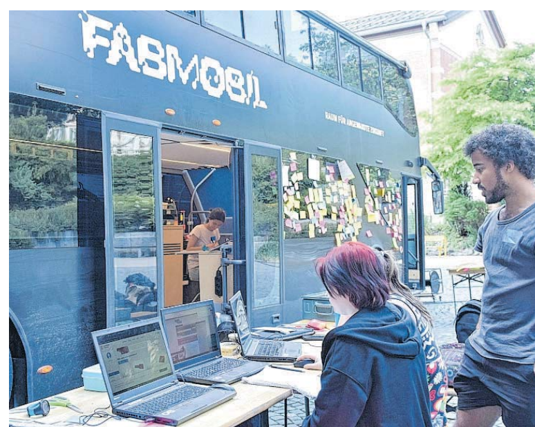
Markneukirchner Gymnasiasten nutzten die Angebote des Fabmobils.