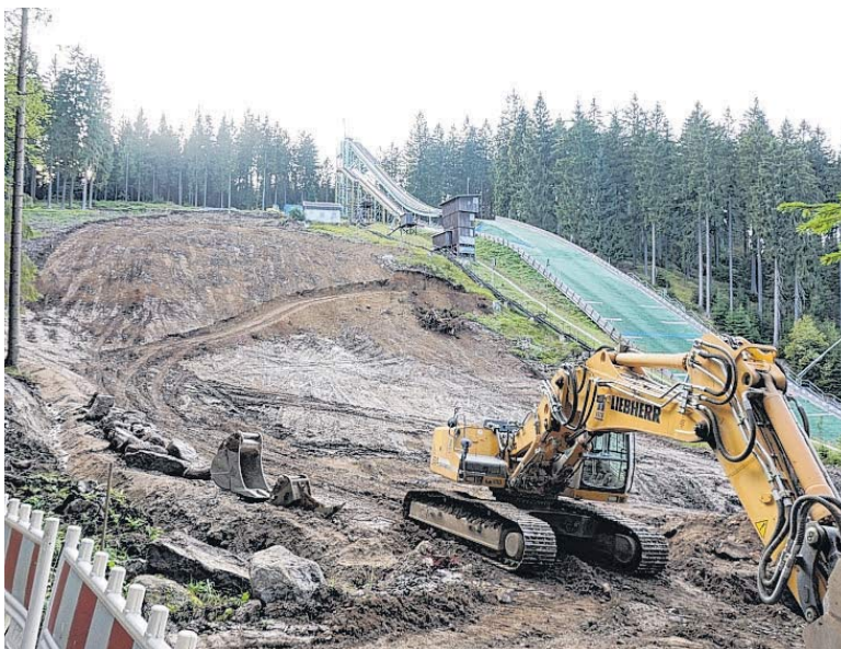
So sah das Schanzenareal im Herbst 2020 aus.

Die offizielle Einweihung des Areals soll laut Ziron natürlich auch auf Schnee erfolgen – im Rahmen der Aschbergsskispiele 2023, die für Januar im Wettkampfkalender stehen. Der Vogtländische Skiclub (VSC) Klingenthal und der Bundesstützpunkt Skisprung/Nordische