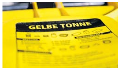
Geht es nach dem Willen der Stadt Bad Elster, wird im Stadtgebiet die Gelbe Tonne eingeführt.

BAD ELSTER – In Bad Elster soll Verpackungsmüll ab 2025 über die Gelbe Tonne entsorgt werden. Diesen Beschluss hat der Stadtrat gefasst, nachdem der Landkreis eine neuerliche Abfrage gestartet hat. Anders als bei einem ähnlichen Beschluss vor anderthalb Jahren gilt das Votum jetzt auch für die Ortsteile Sohl und Mühlhausen. Für Mehrfamilienhäuser und Großwohnanlagen soll es eine Wahlmöglichkeit zwischen Tonne und Sack geben. Wichtig für die Kurstadt ist, dass die Tonnen 14-tägig geleert werden. Der Landkreis will sie nur monatlich leeren, lediglich in Wohnanlagen den Abfall alle zwei Wochen entsorgen. Bad Elster drängt für ein sauberes Stadtbild zudem darauf, die Entsorgung einzelner Abfallarten terminlich zusammenzufassen. |tb