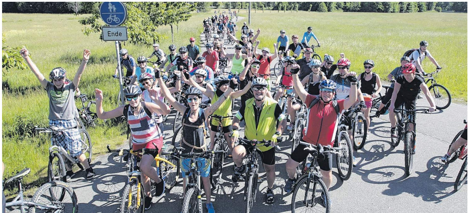
Bis Radler - wie hier den Elsterradweg bei Straßberg - den Mockelbahn-Radweg zwischen Adorf und Roßbach/Hranice erobern - gehen mindestens noch drei Jahre ins Land. Die Stadt Adorf hofft für das deutsch-tschechische Projekt auf eine 80-prozentige Förderung.

Mit dem Geld soll aber nicht der gesamte Radweg, sondern ein 2,36 Kilometer langes Teilstück zwischen der deutsch-tschechischen Grenze und dem Bereich Gettengrün gebaut werden. Im besagten Abschnitt befinden sich vier Brücken, sagte Antje Schröder von der Plauener Ingenieurgesellschaft WTU bei der Projektvorstellung im Stadtrat. Drei dieser Brücken sollen erhalten und saniert werden. Die Kosten belaufen sich hierfür auf