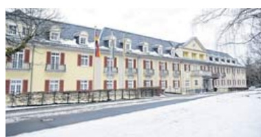
Auf der Rosenhof-Terrasse des Hotels Santé Royale Hotel in Bad Brambach findet das Turmblasen statt.